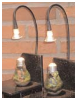
Mini-interiør fra Tropicas stand