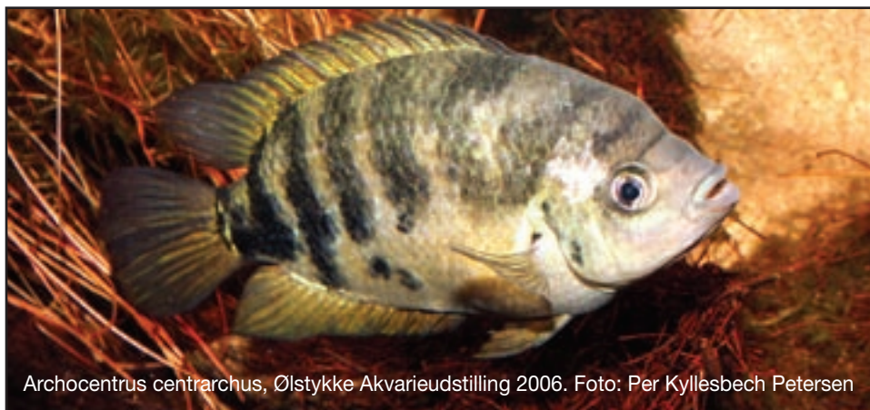
Archocentrus centrarchus, Ølstykke Akvarieudstilling 2006.

Kalenderen indeholder flotte billeder fra både akvarie- og terrariehobbyen.